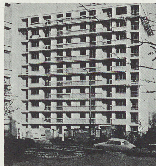
Vue côté rue Pierre-Brossolette

Cité Gaston Roulaud (Bât. D - Esc. 19), rue Roger Salengro 93700 DRANCY - Tél. : 844-03-62 - Chargé de Publicité : P. STRULOVICI