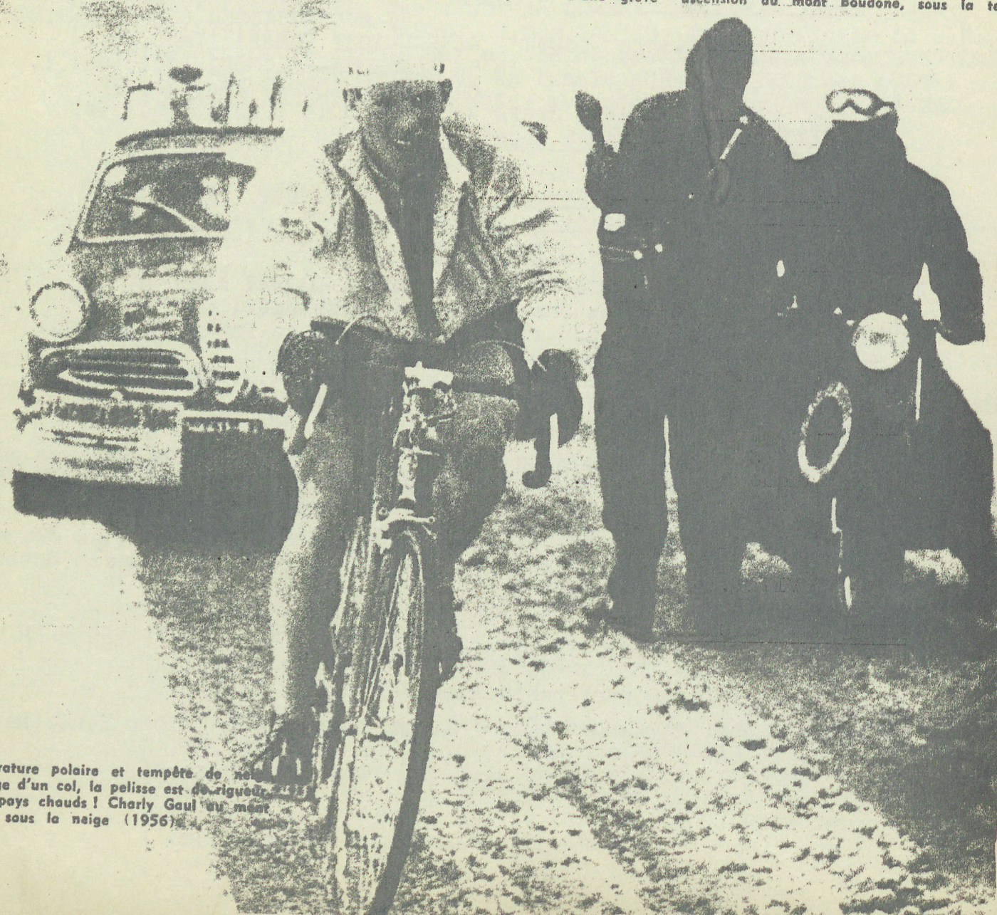
Température polaire et tempête de neige au passage d'un col, la pelisse est de rigueur. Vive les pays chauds ! Charly Gaul au mont Boudone, sous la neige (1956).