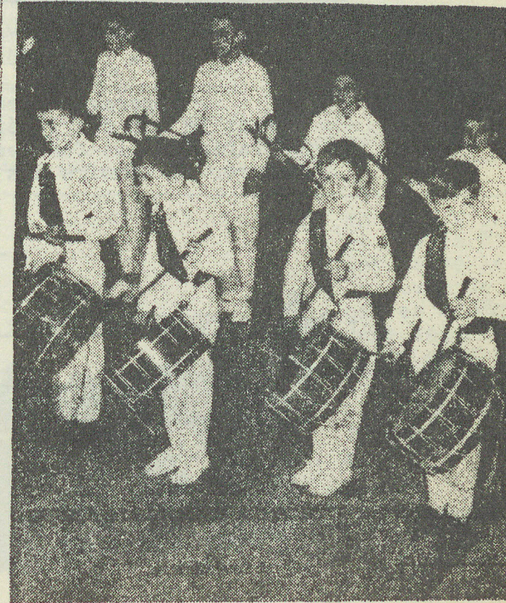
La clique municipale enfantine, qui s'est produite mercredi 8 mai, au cours de la cérémonie commémorative de la victoire de 1945, à laquelle ont participé les nombreuses organisations d'anciens combattants.